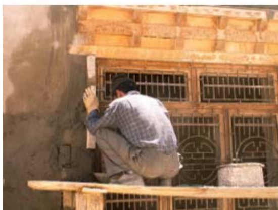
La pose des grilles