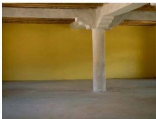
Vue intérieure de la salle d'examens