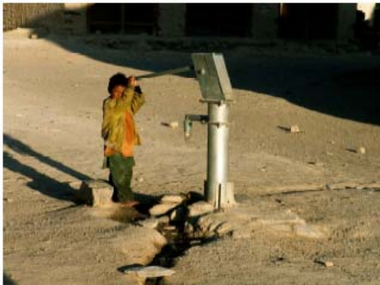
la pompa dell'acqua