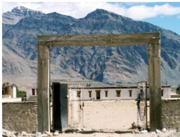
Le portail d'accès aux Staff Quarters en voie d'achèvement