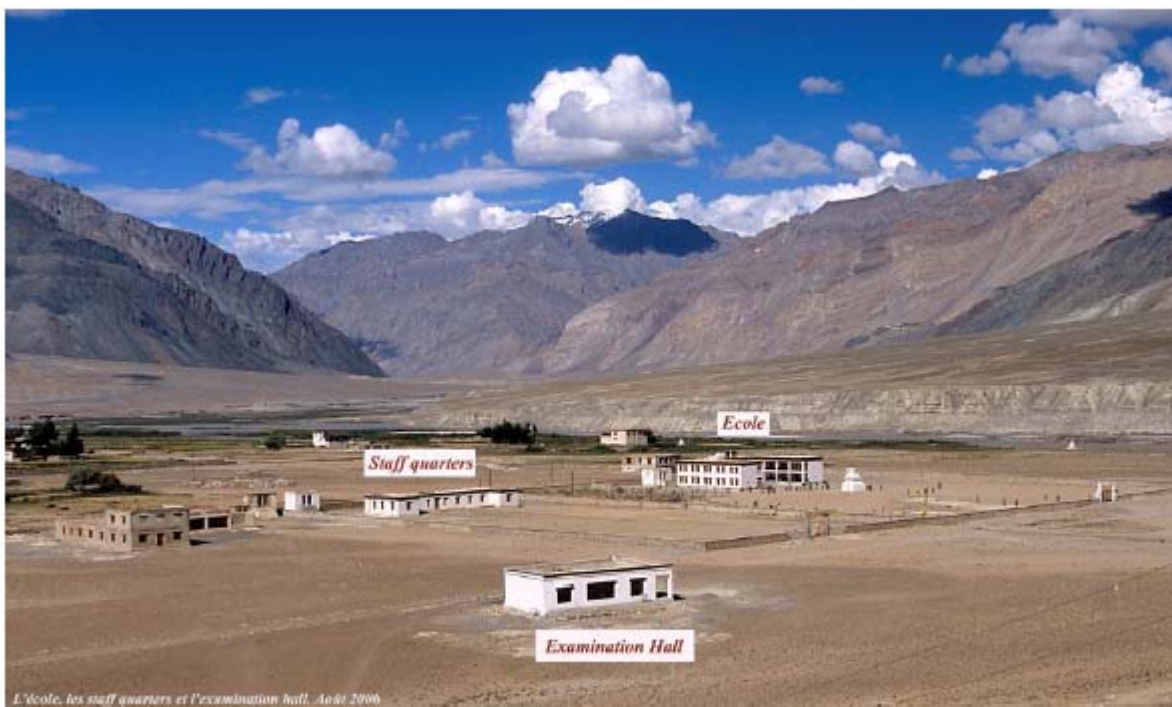
Vue d'ensemble du campus