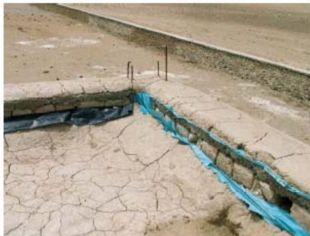
La couche d'argile de la terrasse disparaissant laisse à nu des feuilles de plastique qui finissent par se déchirer sous l'action du vent.