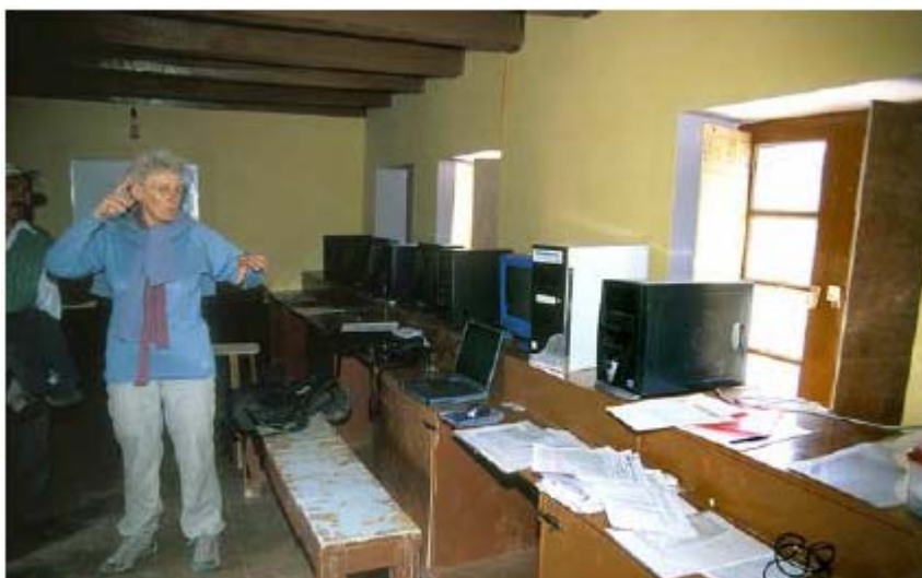
I'aula di informatica