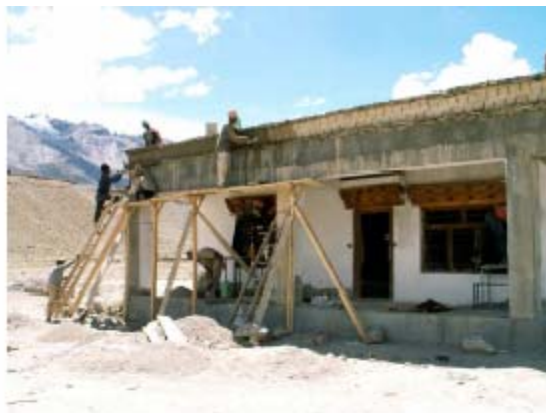
La réalisation du fronton