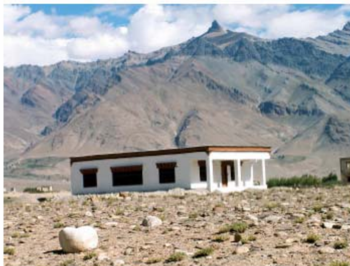
La salle d'examens (Examination Hall)