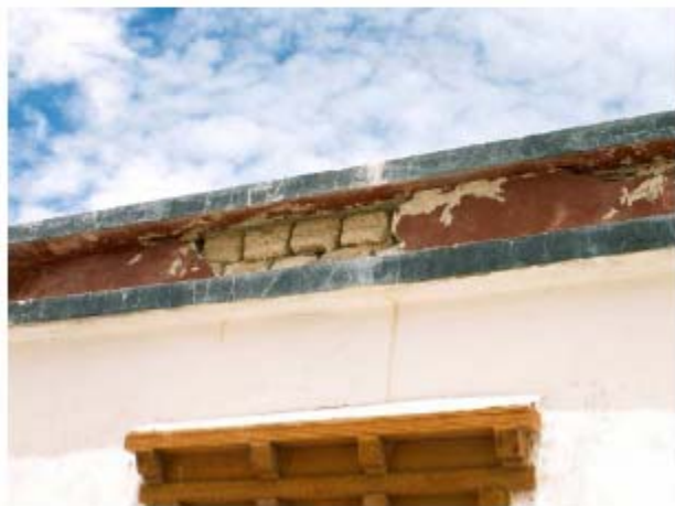
La corniche des Staff Quarters s'effrite par endroits