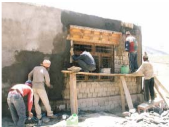
La pose de l'enduit extérieur

I lavori erano in via di completamento il 18 agosto, le inferriate sono state installate, solo i vetri sono ancora da piazzare. La pittura esterna è stata fatta in conformità con gli altri edifici, muri bianche e cornice rosso scuro, e i muri interni sono stati dipinti in giallo.