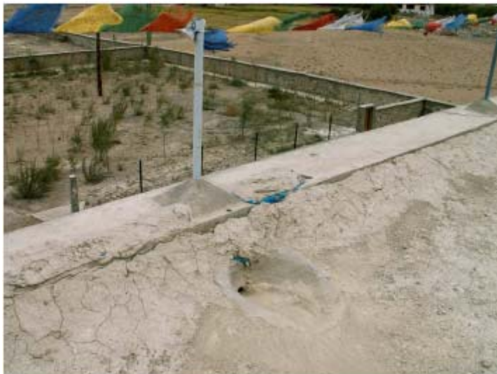
Gli scoli dell'acqua piovana sul tetto dello Staff Quarter (alloggi insegnanti)

La scuola è sempre ben tenuta, tuttavia la pittura esterna dovrà essere rifatta l'anno prossimo. D'altra parte una copertura di argilla supplementare dovrà essere prevista per coprire i bordi dei fogli di plastica che cominciano ad essere scoperti, come nello staff quarter.